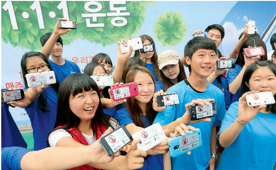
Abb. 2 Südkoreanische Präventionskampagne, zu der eine Reihe von Pressefotos existieren (57), die in der Hauptstadt Seoul im Seoul World Cup Park gegen Smartphone-Sucht veranstaltet wurde. Das Motto der Kampagne, 1-1-1, bedeutet ausschalten, und zwar das Smartphone, durch jeden Einzelnen der mitmacht, an einem Tag der Woche für eine Stunde. Die teilnehmenden Jugendlichen zeigen ihre Smartphones mit Aufkleber für diese Kampagne, um andere Jugendliche zum Mitmachen aufzufordern.

Szenenwechsel: Südkorea 2 ist nicht nur das Land mit der weltweit höchsten Glasfaserverkabelungsquote und dem größten prozentualen Anteil der Internetanschlüsse der Haushalte (98%), sondern auch das der stärksten Nutzung digitaler Informationstechnik durch Kinder und Jugendliche. Schon im Jahr 2013 versuchte man dort daher, die Jugendlichen mit Kampagnen zu einer freiwilligen Einschränkung ihrer Smartphone-Nutzung zu bewegen (►Abb. 2). Der Erfolg dieser Maßnahmen war jedoch nicht besonders stark ausgeprägt, wie die vom südkoreanischen Gesundheitsamt seit Jahren publizierten Zahlen zur Smartphone-Sucht Jugendlicher (im Alter von 10 bis 19 Jahren) belegen (►Abb. 3). Mit knapp 30% Smartphone-süchtigen Jugendlichen dürfte Südkorea auch in dieser Hinsicht weltweit trauriger Spitzenreiter sein.