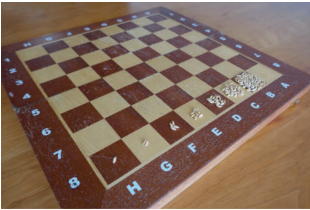
► Abb. 1 Weizenkörner auf einem Schachbrett. Beginnt man mit 1 Korn auf dem ersten Feld und verdoppelt die Zahl auf dem nächsten Feld usw. nimmt die Zahl der Körner exponentiell zu und schon auf das achte Feld passen die Körner nicht mehr: 1, 2, 4, 8, 16 etc., die Zahl der Körner folgt also der Formel 2^{(n-1)} , wobei n die „Nummer des Feldes ist. Folglich befinden sich auf dem ersten Feld 2^{0-1} , auf dem zweiten Feld 2^{1-2} , auf dem dritten Feld 2^{2-4} und auf dem 64. Feld 2^{63} Körner

ten Tag vier usw. Am dreißigsten Tag ist der ganze See bedeckt mit Seerosen. Wie bedeckt war der See einen Tag zuvor?